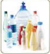
Bouteilles, bidons et flacons en plastique avec leur bouchon