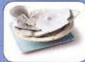
Vaisselle (verre, porcelaine, plastique)