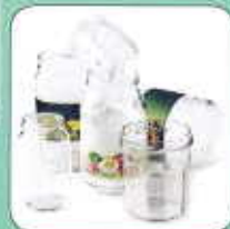
Pots et bocaux