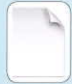
Feuilles de papier