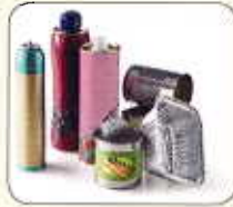
Boîtes, bidons, aérosols et canettes métalliques